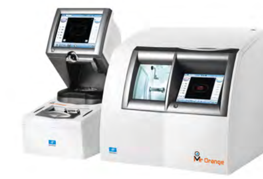
Mr Orange® konfigurace