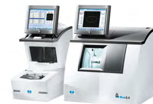
Mr Blue® 2.0 konfigurace